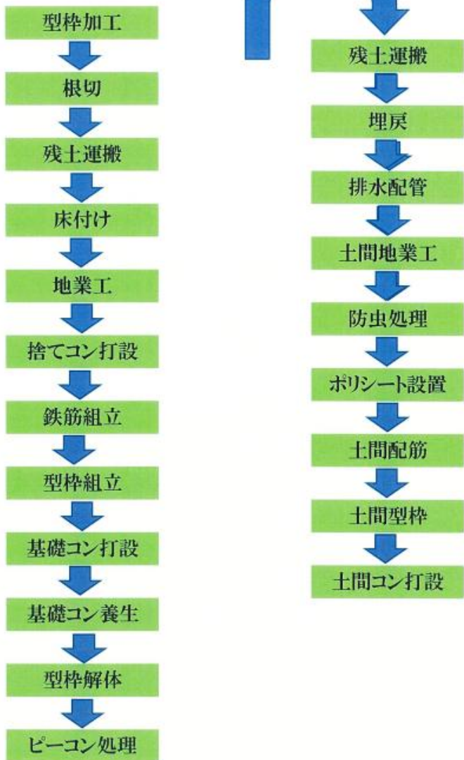
従来建築施工工程